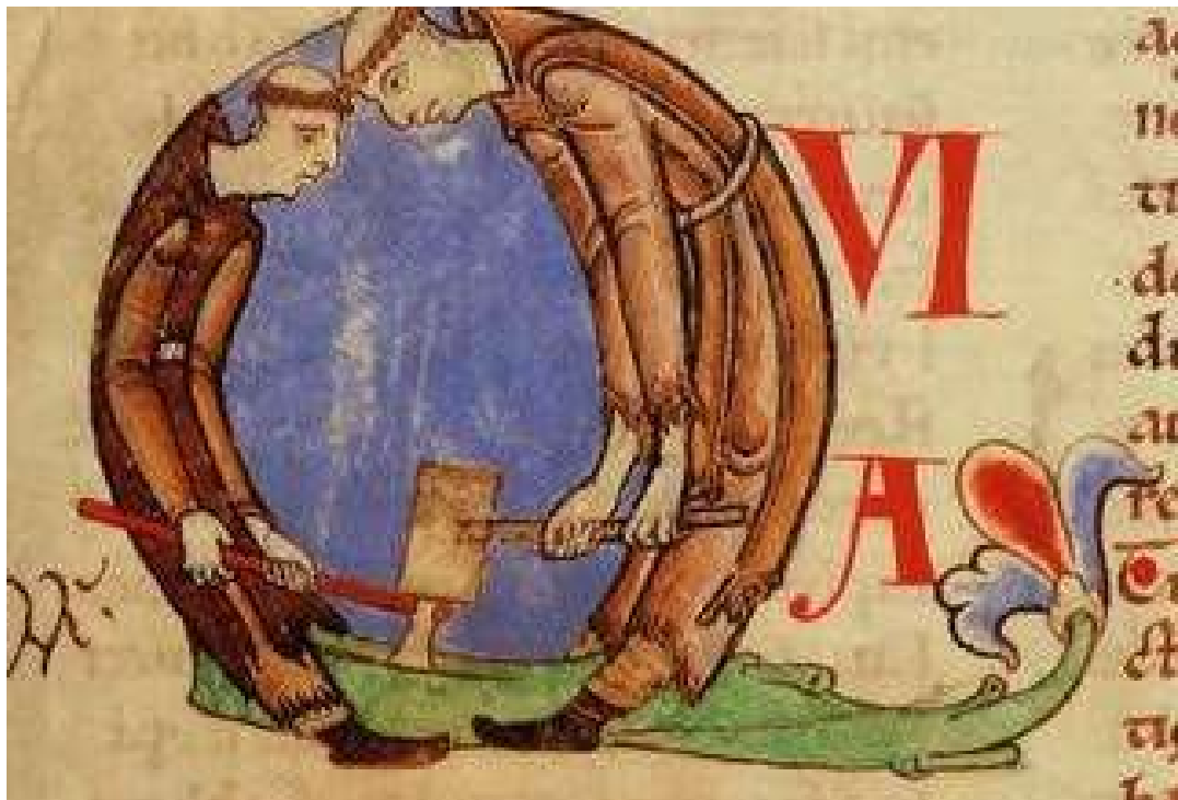
Manuscrito, terminado año 1111 en el Monasterio de Citeaux, de Moralia in Job de San Gregorio Magno, Bibliothèque municipale de Dijon, ms 17, f 59